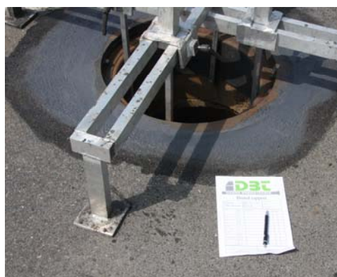
Den flydende karm monteres og faststøbes med bitulan, brøndrapport udfyldes