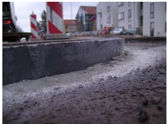
Flydende karm monteret med 30 mm. overhøjde for slidlagsudlægning