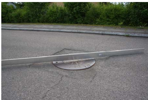
Fast karm udskiftet med flydende på traditionel måde med typiske følgeskader