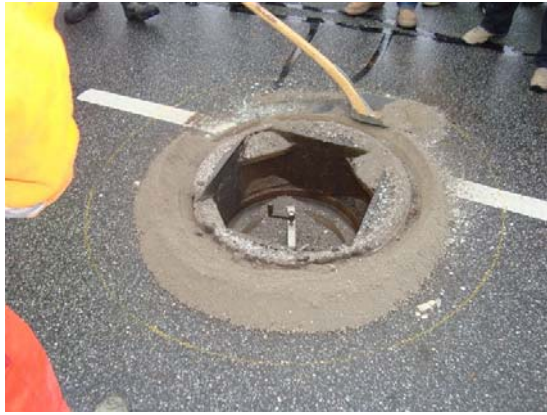
Brønd er afspærret så der ikke falder materiale ned i brønden