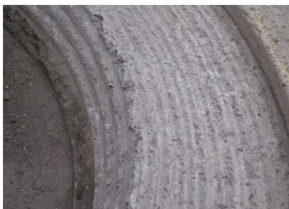
Karmen skæres fri med anlæg for Flydende karm