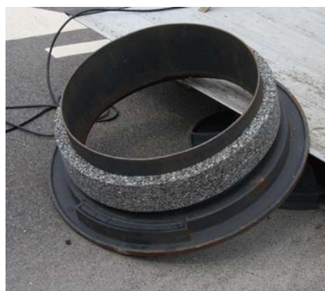
DBT tætningsring monteres på karmen