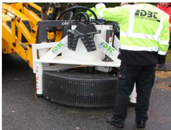
Fræsemaskine placeres over brønden