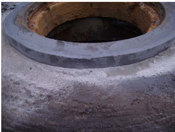
Flydende karm monteret med 30 mm. overhøjde for slidlagsudlægning