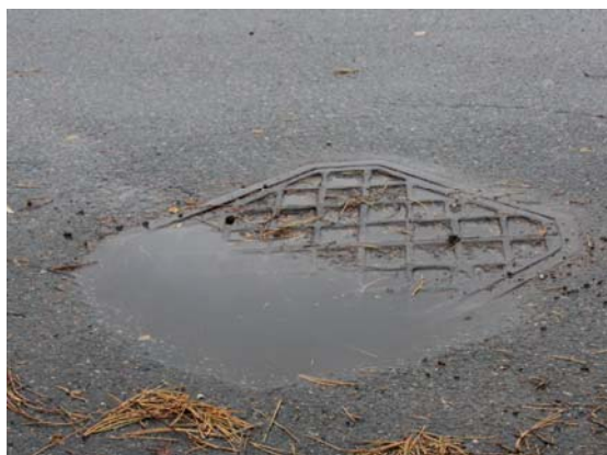
Fast karm Karmen har sat sig ca. 40 mm